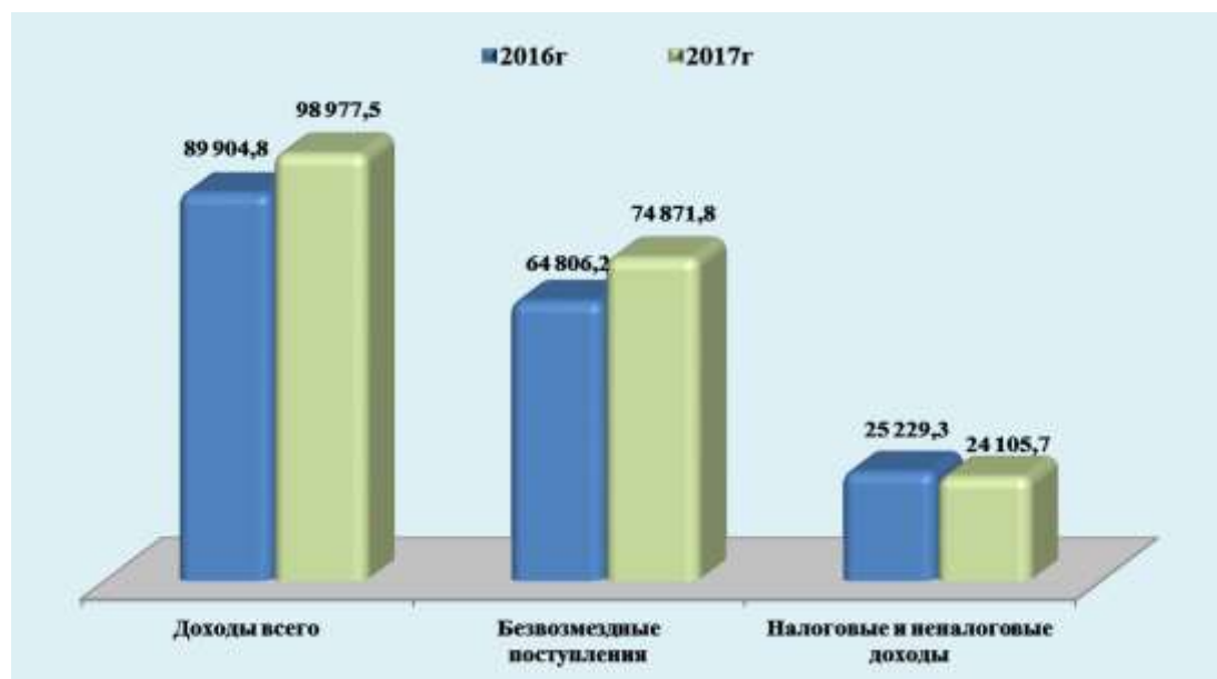
Рисунок 2. Доходы республиканского бюджета Республики Дагестан за 2016-2017 годы млн. рублей[13,14]

По данным годового отчета об исполнении республиканского бюджета Республики Дагестан доходы республиканского бюджета за 2017 год фактически составили 98 977 508,9 тыс. рублей, или 100,3 % от утвержденных (уточненных) назначений (98 727 036,9 тыс. рублей). .....